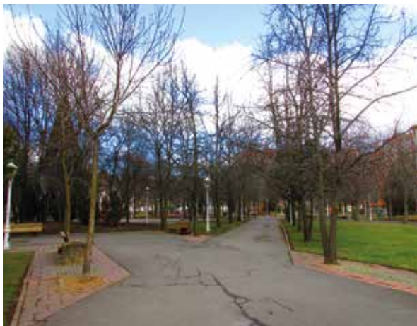
Parque Virgen del Camino, Polígono 10

' ÁREA 17 ' en el paraje denominado 'El Soto' se levantó a comienzos del siglo XXI un amplio sector urbanístico denominado 'Área 17'. El nuevo barrio tiene como centro neurálgico es el bullicioso centro comercial 'Espacio León'.