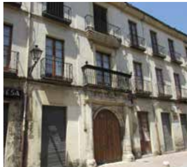
Edificio en la Calle de la Rúa que será reconvertido en albergue

Este proceso cambia el aspecto del barrio y desaparece el vecindario en las zonas con "potencial" turístico, se generan carestías de equipamientos y servicios (¿dónde puede comprar una barra de pan una vecina del barrio