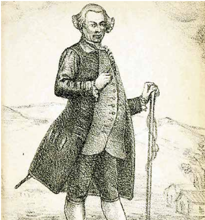
▲ Imagen de un corregidor del siglo XVIII