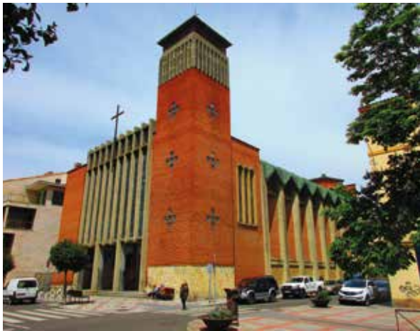
Iglesia Jesús Divino Obrero