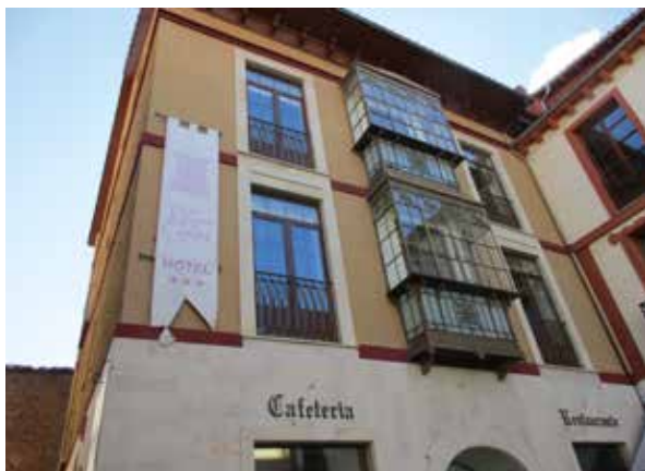
Edificio destinado a hotel en Casco Antiguo de León