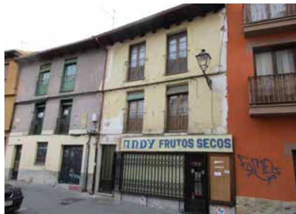
El comercio tradicional desaparece de la ciudad antigua de León